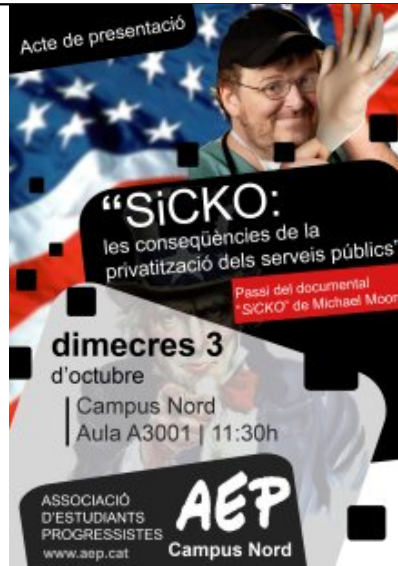
AEP - UPC (Campus Nord): Dimecres 3 d'octubre, 11h30, Aula A3001 Passi del documental Sicko de Michael Moore